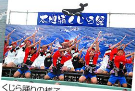
くじら踊りの様子