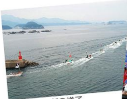
漁船パレードの様子

毎年11月1日曜日に太地漁港ふれあい広場の一角に特設舞台を組んで行われる「太地浦くじら祭」では、くじら踊りや子どもいさな太鼓などの郷土芸能が披露されるほか、市町村による食品パザールや鯨肉の販売などが人気。また、大漁旗をはためかせた約15隻の漁船パレードも圧巻です。