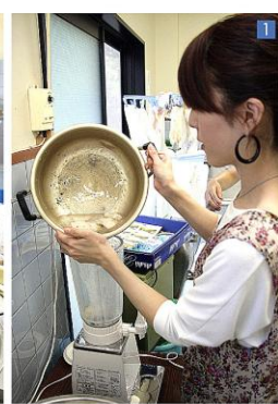
トドロに煮詰めたこんにやく芋をミキサーに

続いて、こんにやく作り体験。 (1)まず、こんにやく芋を茹でたものと水をミキサーでまぜてペースト状に。 (2)まじったものをよくこねある程度粘りが出たら、凝固剤を入れて、さらにこねます。根気と力がかかる作業です。 (3)続いて、その型に入れて四角と丸の2種類に成形していきます。 「手作りならではやから、多少イビツでも全然構わんよ」お母さん、優しいし、約30分ほど茹でる完成!