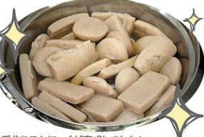
手作りこんにやくが完成しました!