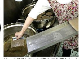
「熱いよ...? 大丈夫かなあ?」